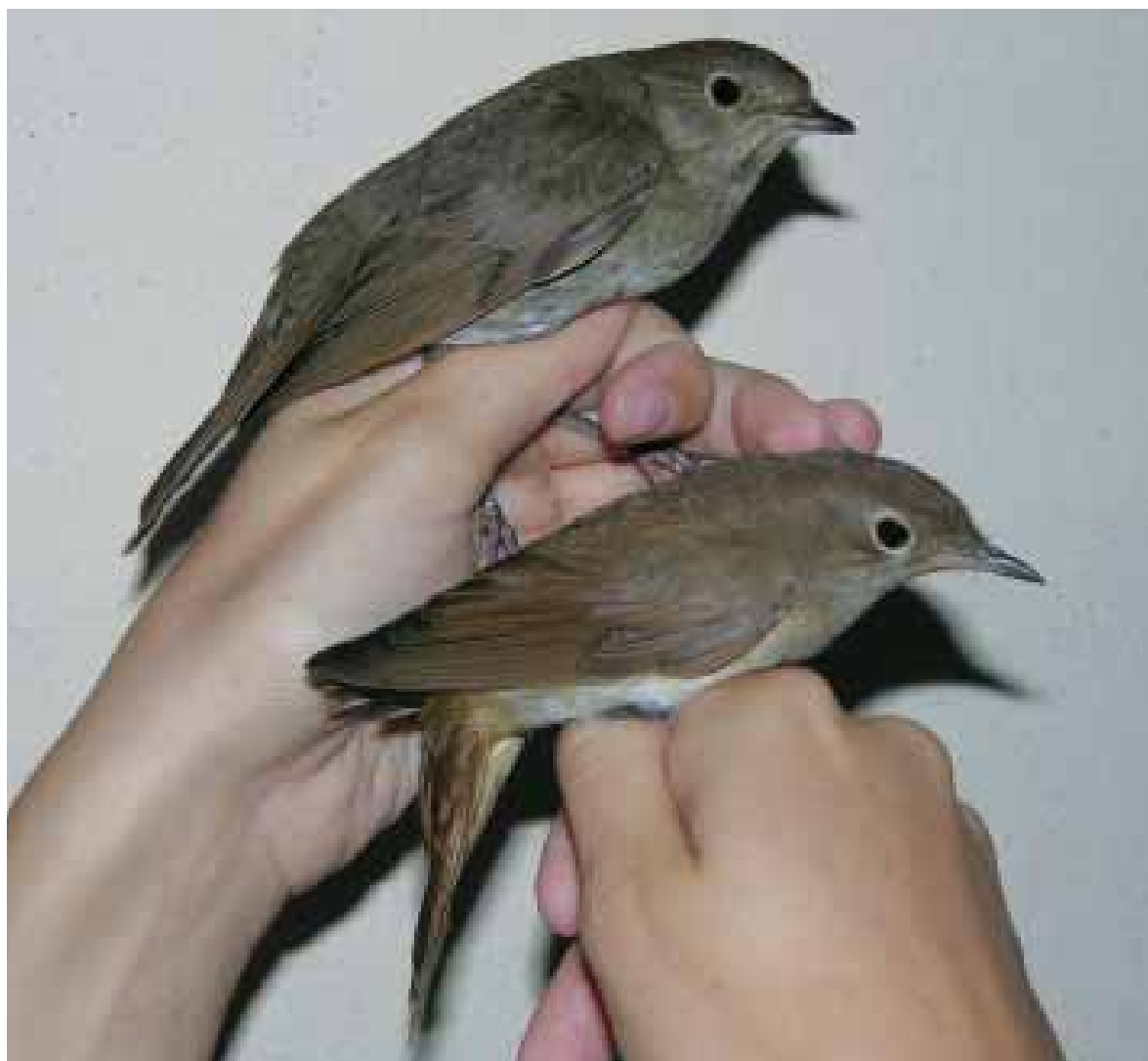
Fig. 2 - Usignolo maggiore ( Luscinia luscinia , in alto), giovane dell'anno inanellato il 1 settembre a Bosco Vedro, Cameri NO; prima segnalazione per il Piemonte.