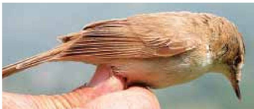
Fig. 3 - Cannaiola di Jerdon ( Acrocephalus agricola ), inanellata il 27 maggio ad Isolino, Verbania; prima segnalazione per il Piemonte.