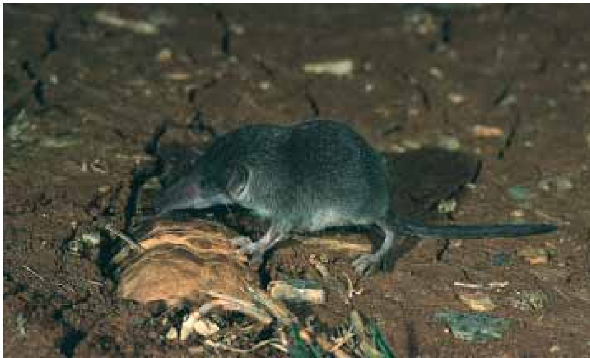
Fig. 2 - Crocidura ventre bianco Crocidura leucodon .