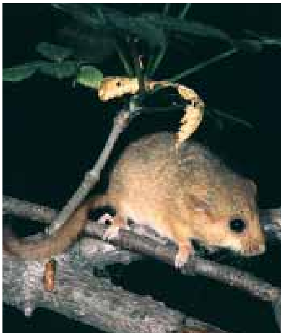
Fig. 4 - Moscardino Muscardinus avellanarius .