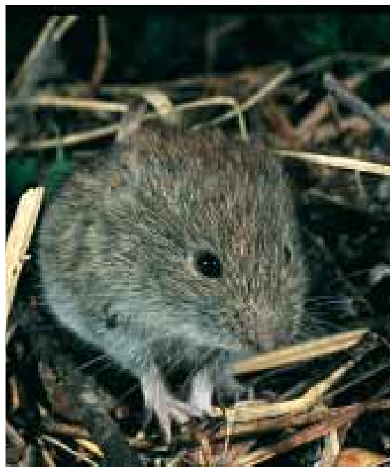
Fig. 5 - Arvicola rossastra Clethrionomys glareolus .