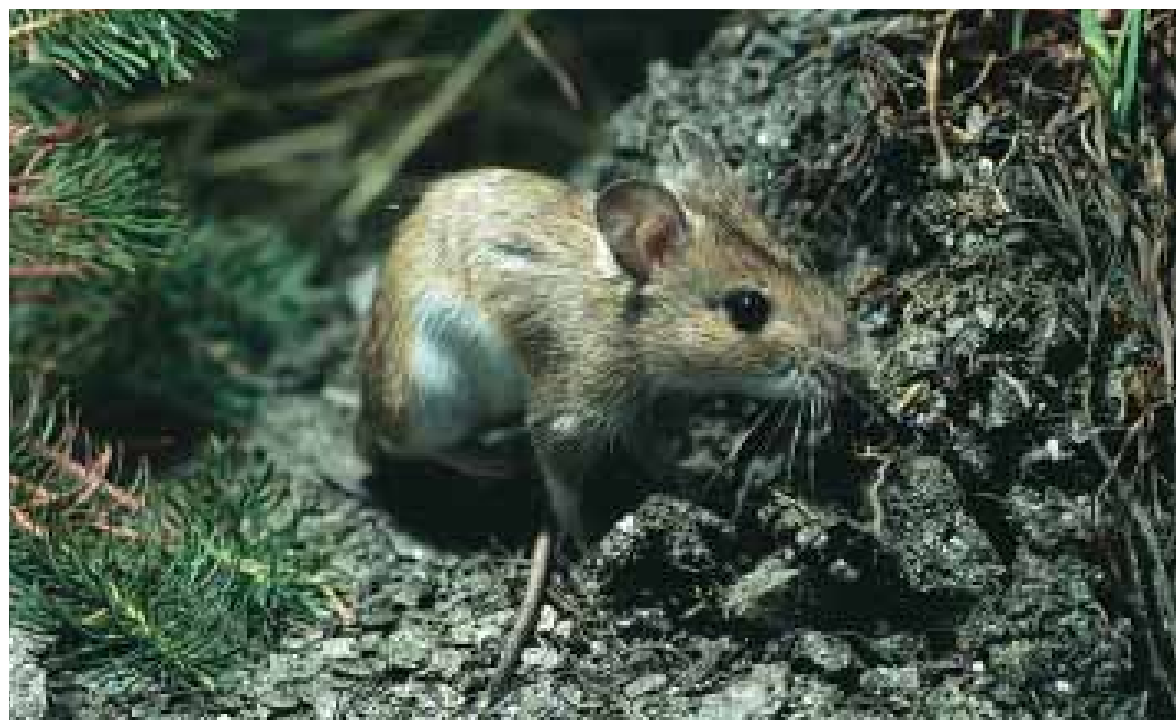
Fig. 6 - Topo selvatico Apodemus sylvaticus .