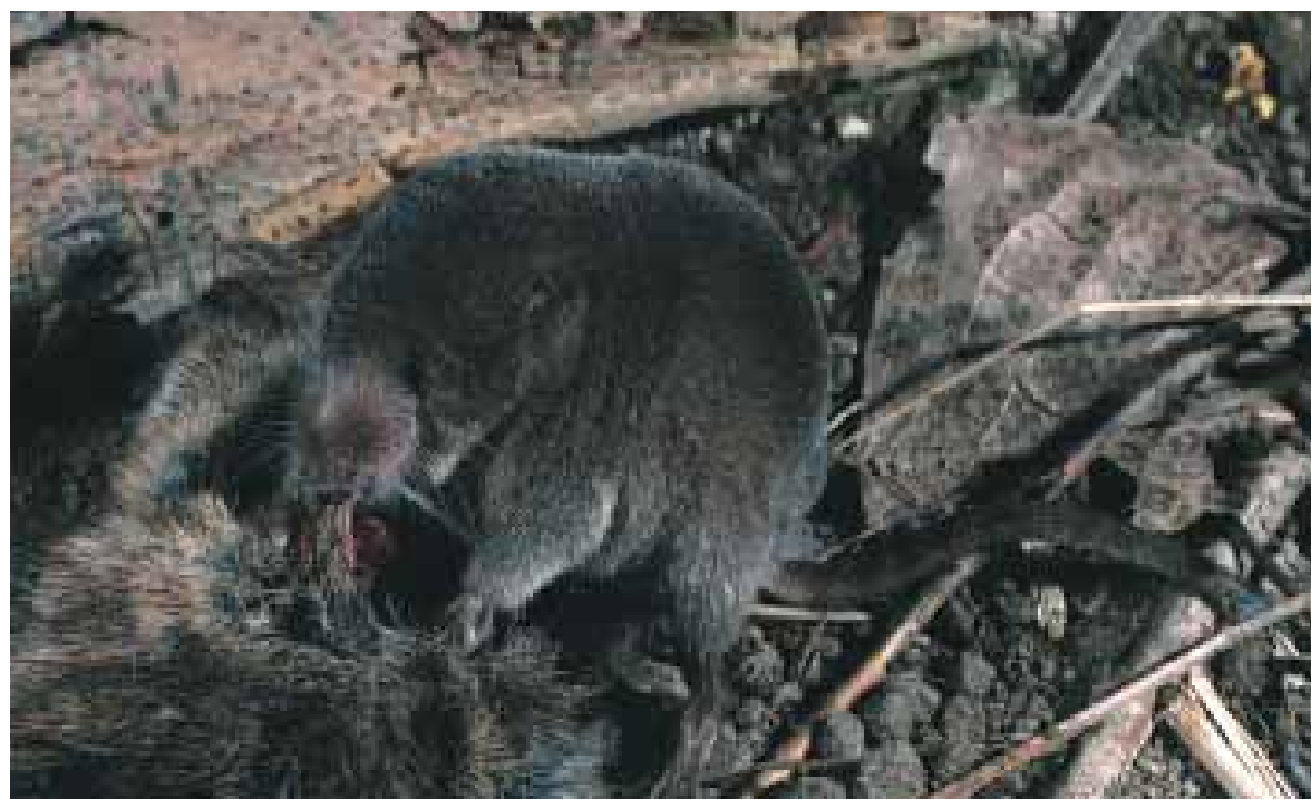
Fig. 3 - Toporagno comune Sorex araneus .