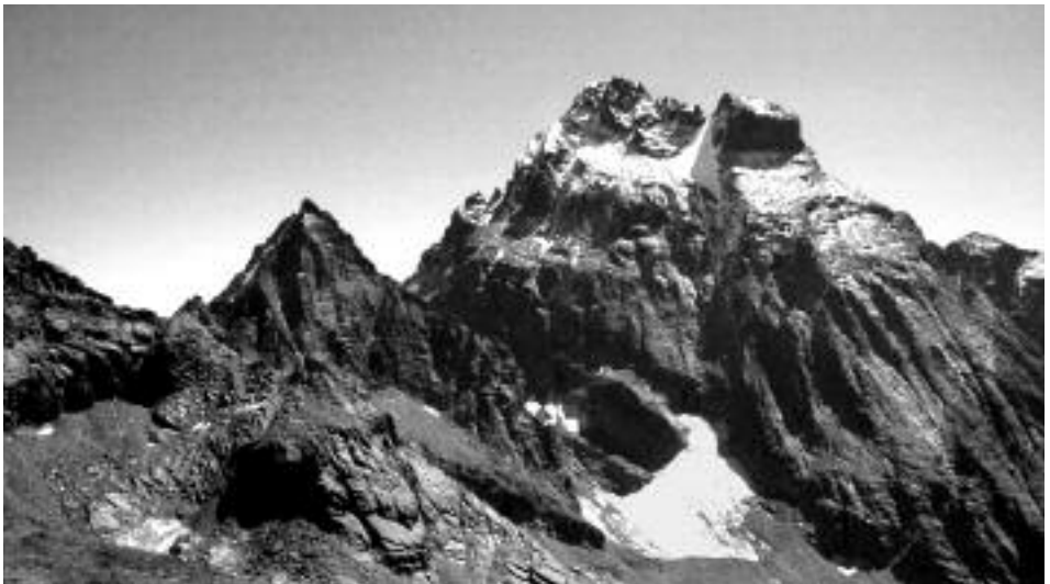
Fig. 3 - Il Vallone di Vallanta, dominato dal Monviso, modellato nelle pietre verdi (29.VIII.1987).