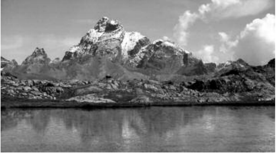
Fig. 2 - Rocce montonate nell'ampio terrazzamento di escavazione glaciale del Col Longet (23.VIII.2005). Sullo sfondo il Monviso.