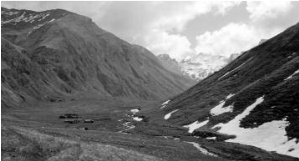
Fig. 9 - Il Vallone di Soustra (25.V.1998) inciso nei calcescisti. La prateria alpina colonizza i pendii in modo continuo sino a quote molto elevate.

Nell'orizzonte montano superiore delle conifere (tra 1400-1500 m e 1800-2200 m) prevale il larice ( Larix decidua ) (fig. 7). Peraltro lungo l'arido versante sinistro – a monte di Sampeyre e di Casteldelfino (alle pendici del versante Sud del Monviso) – si estende il Bosco dell'Alevé, il più