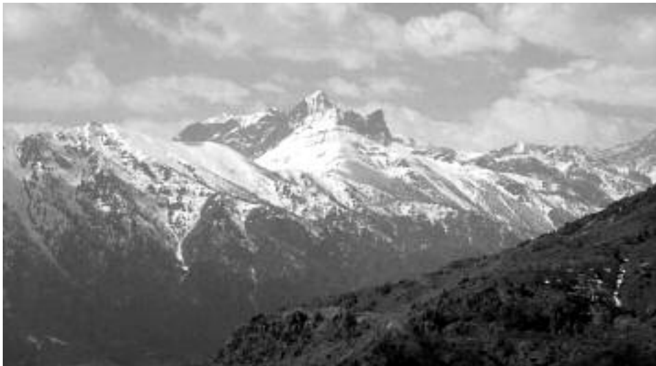
Fig. 6 - La diversa estensione della copertura nevosa evidenzia i contrasti di esposizione tra i due versanti della Val Varaita (23.IV.2003). Sullo sfondo il Pelvo d'Elva.