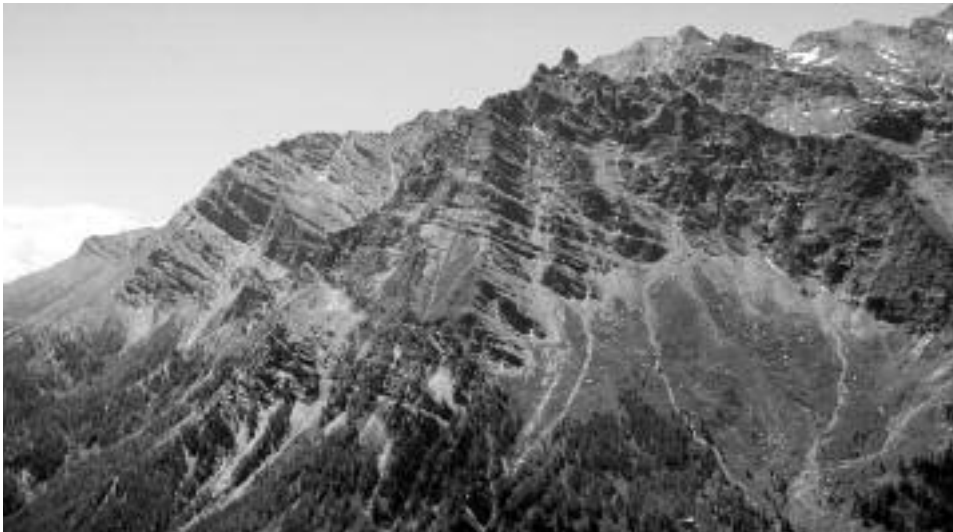
Fig. 7 - Calcescisti e filladi a reggipoggio nel Vallone di Chianale (1.VII.2005). Le falde detritiche sono diffusamente colonizzate dalla prateria alpina e da foreste di larici.