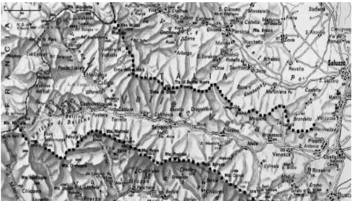
Fig. 1 - La Val Varaita, area oggetto della ricerca.

L’abitato di Costigliole Saluzzo, situato a 480 m di quota nei pressi dell’imbocco, è il punto più basso della valle.