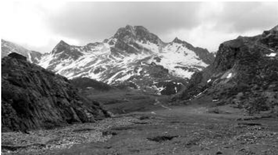
Fig. 5 - Il terrazzamento di escavazione glaciale del Pian Traversagn (5.VI.2006). Sullo sfondo la Rocca La Marchisa.