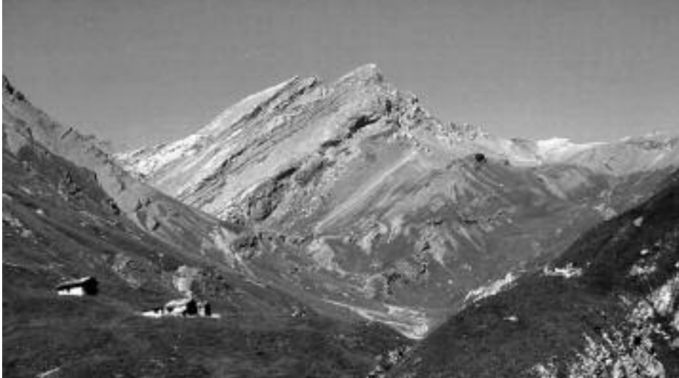
Fig. 4 - Il Vallone del Rui (25.VIII.2004) modellato nei calcescisti dall'esarazione glaciale. Sullo sfondo il Monte Salza.