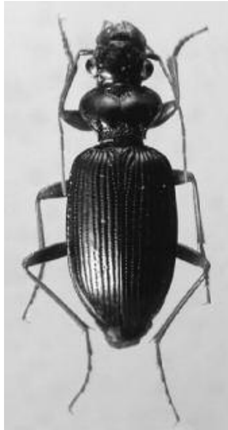
Fig. 10 - Leistus fulvibarbis .