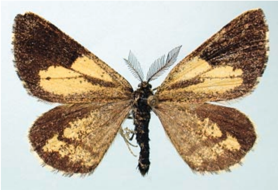
Fig. 12 - Bupalus piniarius (Linnaeus, 1758) (Valdieri (CN), Valle della Valletta, Gias della Casa).

Giaveno (TO), Aquila, m 1255, 04.07.1991.