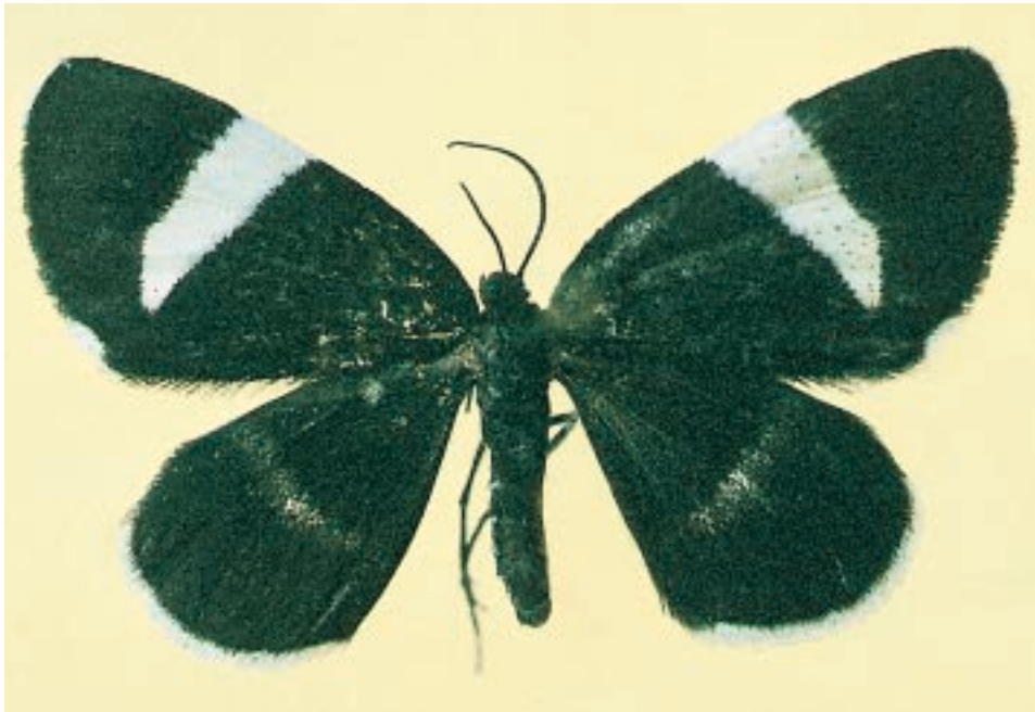
Fig. 3 - Baptria tibiale (Esper, 1791): unico esemplare di questa collezione, proveniente dal comune di Demonte (CN).

Montaldo Roero (CN), 1,4 km a NW dell'abitato, m 370, 10.06.1991.