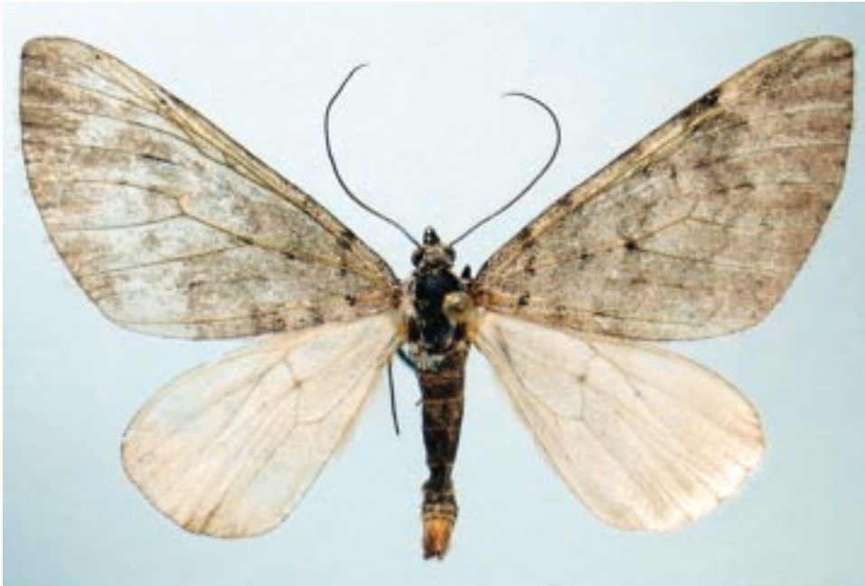
Fig. 8 - Aplocera simpliciatata (Treitschke, 1835), dall'alta Valle di Ala (TO).

Caramagna Piemonte (CN), Bosco del Merlino, m 250, 30.05.1991; Cavour (TO), C.na Pavarino, m 264, 13.06.1991; Monteu Roero (CN), S.