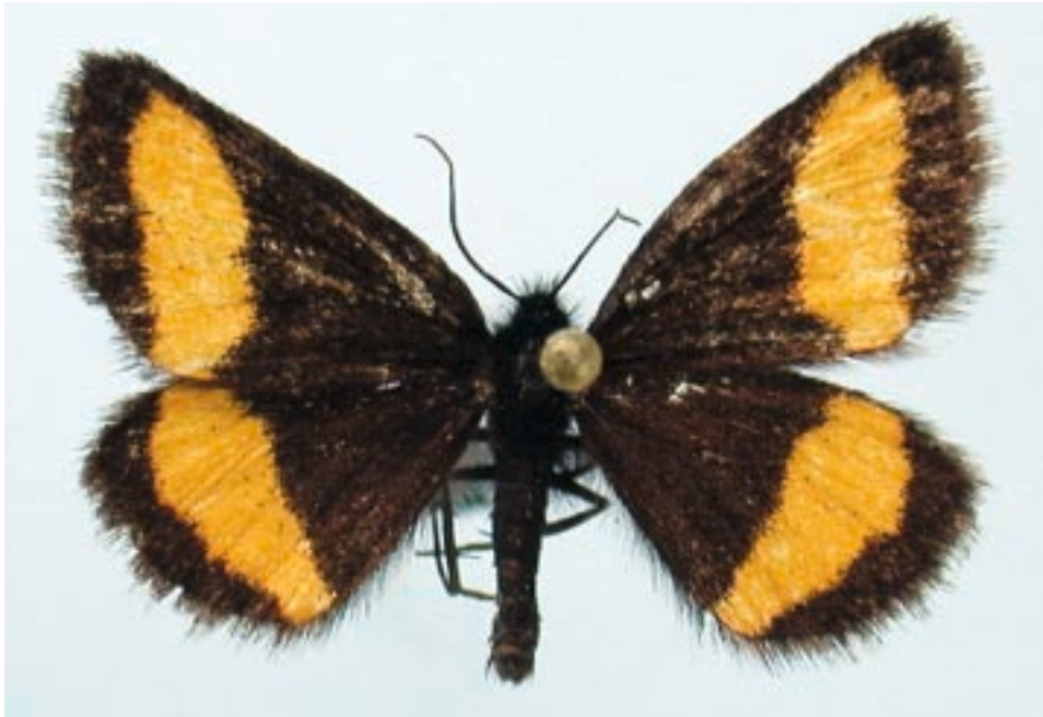
Fig. 13 - Psodos quadrifaria (Sulzer, 1776), esemplare raccolto nel Vallone Rochemolles, comune di Bardonecchia (TO).

Piossasco (TO), Ciampetto, m 440, 09.06.1991; Case Levrino, m 580, 11.06.1991; Val della Torre (TO), Truc di Brione, m 390, 27.05.1992.