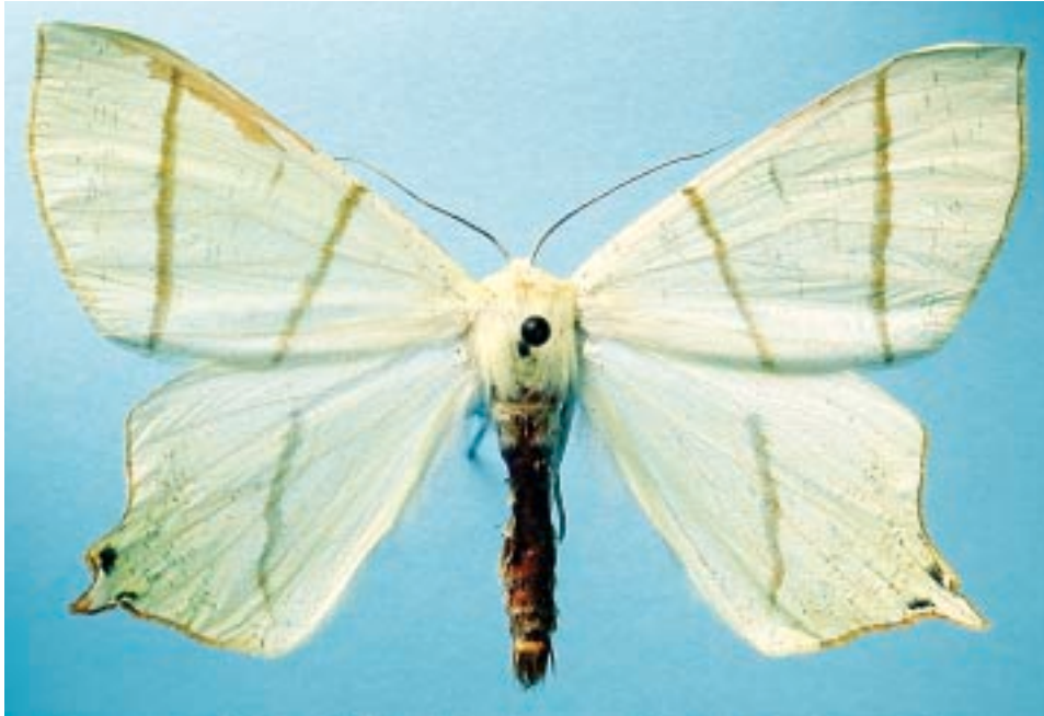
Fig. 11 - Ourapteryx sambucaria (Linnaeus, 1758) esemplare proveniente dal comune di Frabosa Soprana (CN).

Piossasco (TO), m 380, 22.11.1991, O. E. Bonora leg. et don.