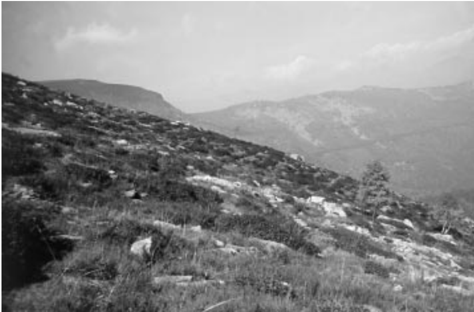
Fig. 7 - Paesana (CN), località Rocca della Crivella, seconda stazione di raccolta di Carsia lythoxylata.

Bra (CN), C.na del Priore, m 301, 21.06.1991; Candiolo (TO), Fontana Nido dell'Asino, m 248, 12.06.1991; Piossasco (TO), Ciampetto, m 440, 09.06.1991; Pralormo (TO), Madonna della Spina, m 321, 08.04.1991.