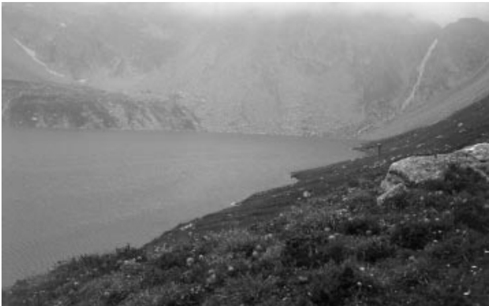
Fig. 2 - Prateria d'alta quota sulle sponde del Lago Serrù (Ceresole Reale (TO), Parco Nazionale del Gran Paradiso), habitat di Psodos quadrifaria.