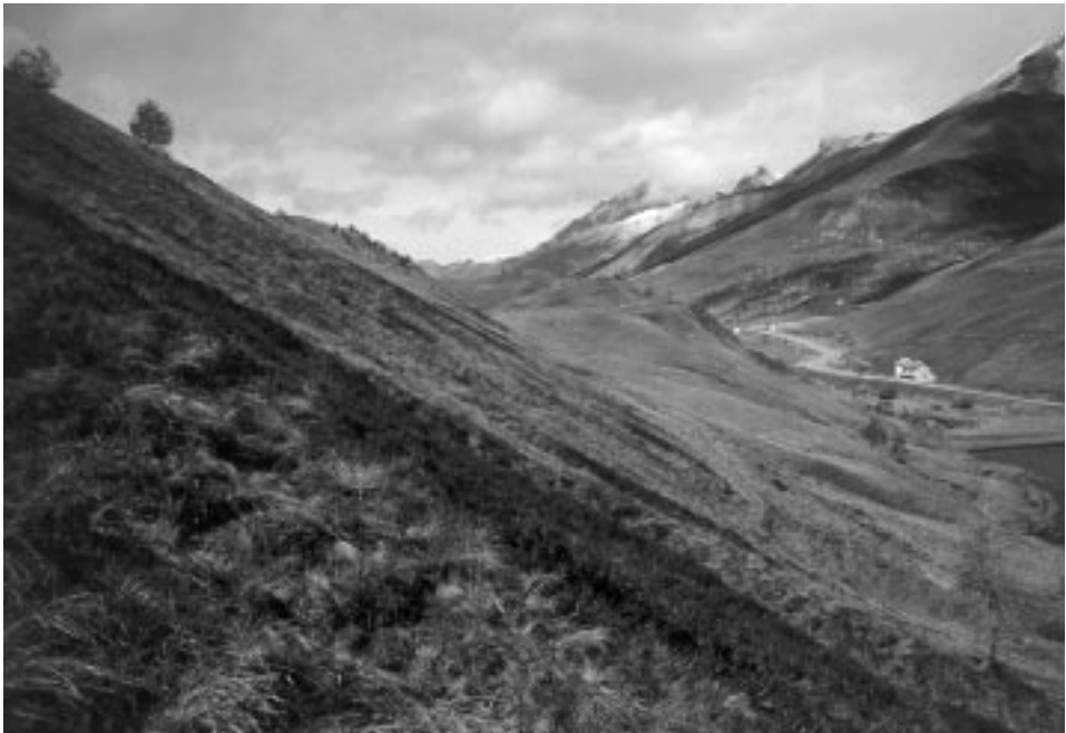
Fig. 6 - Argentera (CN), Colle della Maddalena, una delle due stazioni di raccolta di Carsia lythoxylata.

Pralormo (TO), Madonna della Spina, m 321, 08.04.1991.