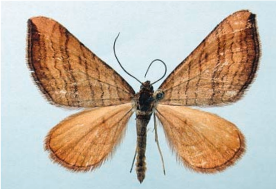
Fig. 5 - Carsia lythoxylata (Hübner, [1799]), soggetto proveniente dall'alta Valle Stura di Demonte.

Castelmagno (CN), Chiappi, m 1640, 14.07.1991; Pietraporzio (CN), V.ne di Pontebernardo, Prati del Vallone, m 1720, 14.07.1993; Sestriere (TO), lungo il Torrente Chisonetto, m 2050, 31.07.1993; Usseaux (TO), Bacino di Pourrieres, m 1390, 28.07.1991; Valdieri (CN), Tetti della Puera, m 900, 10.06.1993.