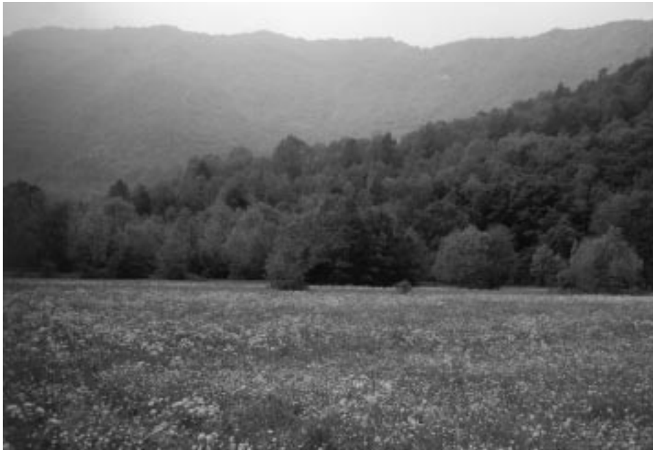
Fig. 4 - Prati nella conca di Bergemolo, habitat di Baptia tibiale.

Acceglio (CN), Chiappera, Grange Collet, m 2000, 02.08.1995; Angrogna (TO), Prà del Torno, m 1100, 08.07.1991; Carmagnola (TO), Greto