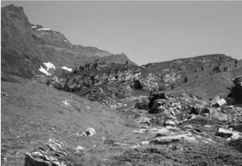
Fig. 9 - Balme (TO), località Giasset, m 1900, l'unica stazione nota di Aplocera simplicata.

Borgone di Susa (TO), Losa, m 540, 03.06.1992; Carmagnola (TO), C.na Grangia, m 260, 04.06.1991; Frabosa Soprana (CN), Ponte del Muraio, m 970, 20.07.1992; San Pietro Val Lemina (TO), Rineugna, m 545, 20.06.1991; Valgrana (CN), Masineri, m 710, 14.06.1991.