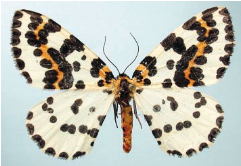
Fig. 10 - Abraxas grossulariatus (Linnaeus, 1758) da Varisella (TO), località Moncolombone.

Ceresole Reale (TO), V.ne del Carro, m 1920, 26.07.1994.