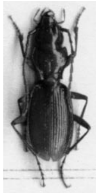
Fig. 3 - Troglorites brevili Jeannel, 1919 (dimensioni reali mm 10).